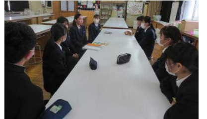
昨年より多い参加者でした

1月15日（月）、保育士志望の1、2年生と保育士養成の学校に進路決定した3年生が座談会を行いました。1、2年生は3年生から受験対策などについて、貴重なアドバイスを受けることができました。