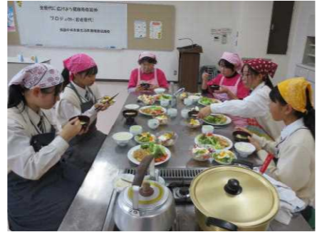
スープの塩分を計測