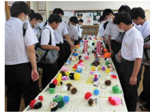
ポンポンマスコット（1年生）

文化祭後、ペットボトルキャップアートは一昨年のドラえもん、昨年のみきゃんと一緒に被服教室横の廊下に展示していますので、まだ実物を見ていない人はぜひ見てください。