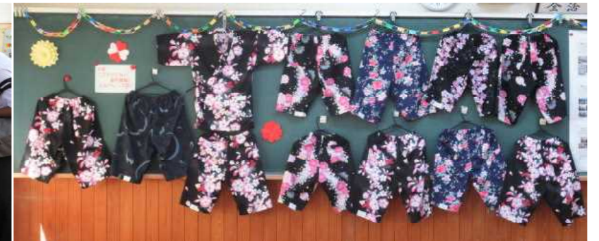
じんべい（3年「ファッション造形基礎」選択生）