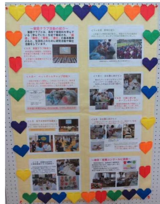
家庭クラブ活動報告