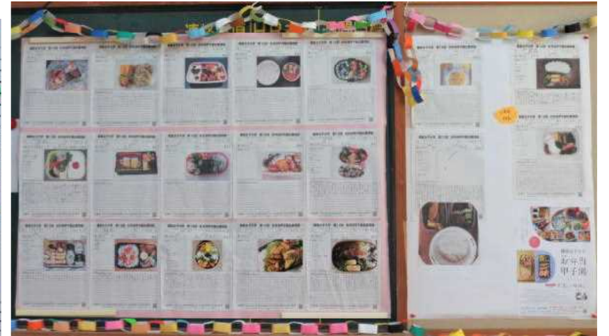
お弁当甲子園応募作品