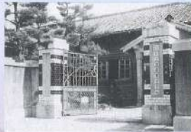
昔の校舎(川之江高等女学校)