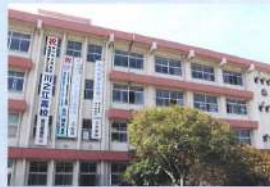
現在の校舎(令和6年)