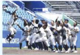
甲子園出場(令和5年)