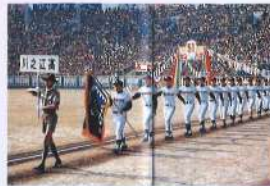
甲子園初出場(昭和54年)