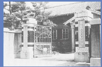
昔の校舎(川之江高等女学校)