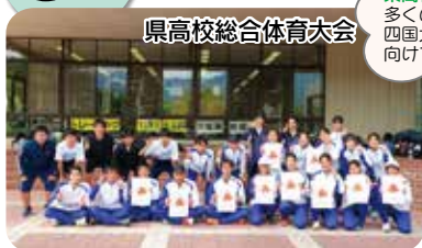
県高校総合体育大会

県高校総合体育大会 多くの部活動生が 四国大会や全国大会に 向けて頑張っています！