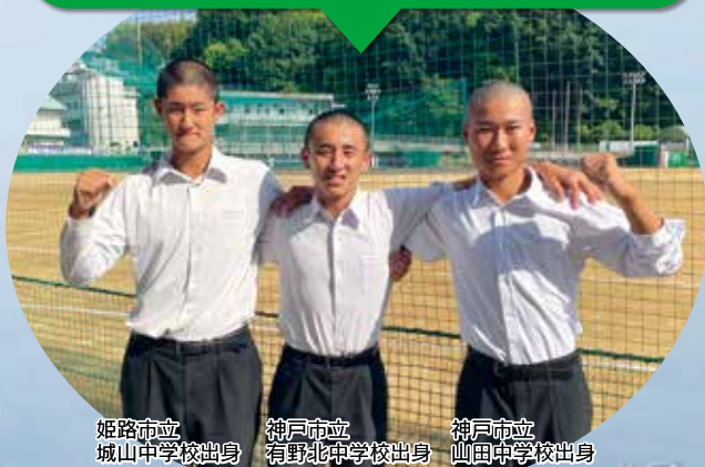
姫路市立 城山中学校出身