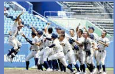
甲子園出場(令和5年)