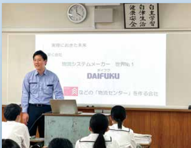
神戸市立 山田中学校出身