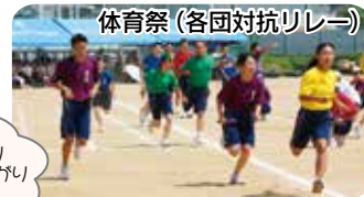
体育祭 (各団対抗リレー)