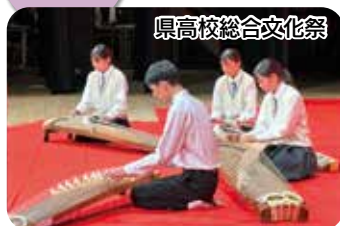
県高校総合文化祭