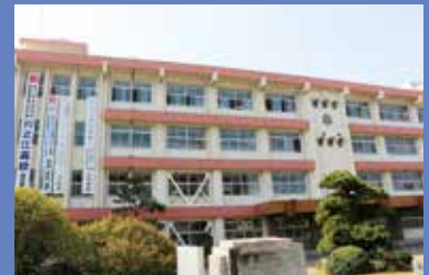
現在の校舎(令和7年)