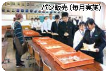
パン販売 (毎月実施)