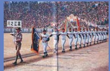
甲子園初出場(昭和54年)