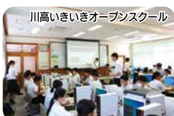
川高いきいきオープンスクール