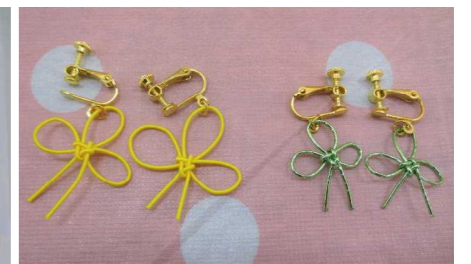
シトラスリボンイヤリング