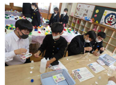
スノードーム作り