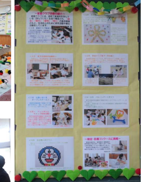
家庭クラブ活動報告