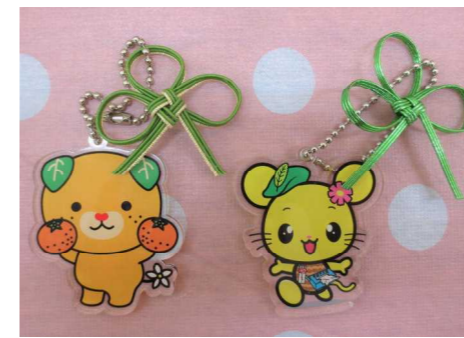
シトラスリボンキーホルダー

11月2日、文化祭において「家庭クラブ活動・家庭科作品展」を行いました。1年生のポンポンマスコットなどの展示のほか、今年もコロナ感染者及び医療従事者への偏見や差別防止を掲げた「シトラスリボンプロジェクト」に賛同した活動を行いました。水引シトラスリボンキーホルダー、イヤリングを購入してくださった皆さん、スノードーム作りを体験してくださった皆さん、ありがとうございました。売上金のうち 6,510 円 を歳末たすけあい募金に寄付させていただきました。