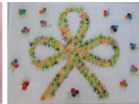
壁面飾り「あったかしこちゆ〜つなぐシトラスリボン」