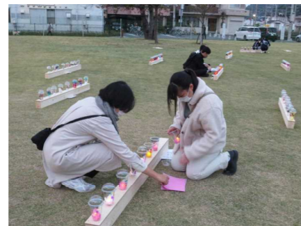
ランタンを並べる