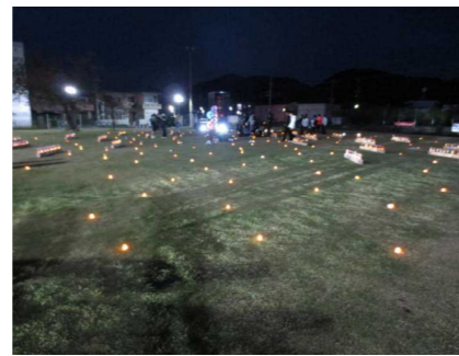
暗くなるときれいでした☆