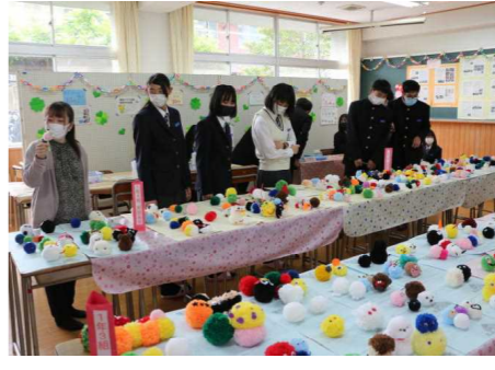
ポンポンマスコット