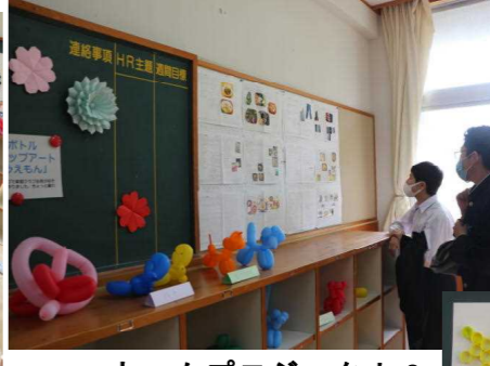
ホームプロジェクト&バルーンアート